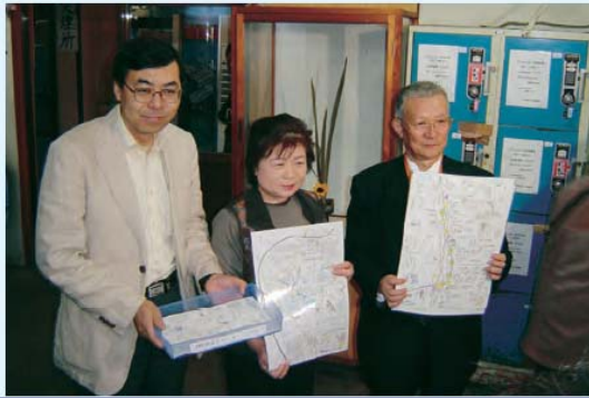
会員手作りによる「津軽沿線散策マップ」