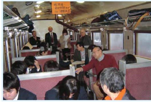
若者の視点で鉄道や沿線地域の活性化を考える「放課後まちづくりクラブ in 津軽鉄道」